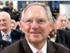
Bundes- finanzminister Wolfgang Schäuble