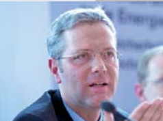
Bundes- umweltminister Norbert Röttgen