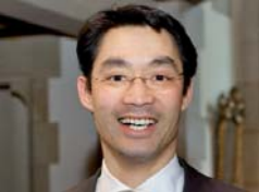
Bundes- gesundheitsminister Philipp Rösler